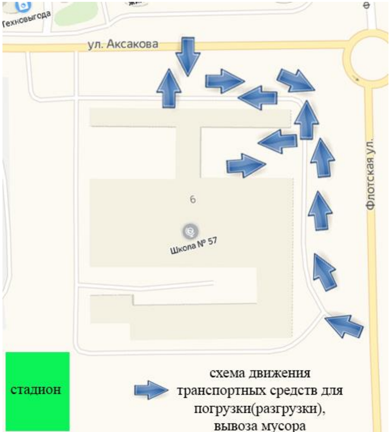
Схема пути движения транспортных средств к местам разгрузки/погрузки, вывоза мусора по территории образовательного учреждения